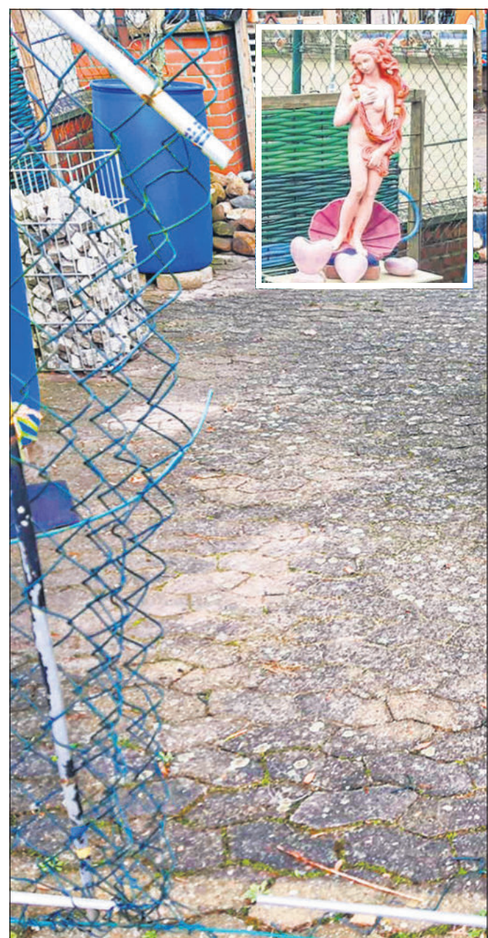
Der Zaun wurde von den Unbekannten durchgeschnitten. Gestohlen wurde unter anderem eine Puppenfigur (kleines Bild)

Übrigens: Der Garten des ALZ ist ab dem 16. April wieder mehrmals in der Woche geöffnet. Dann finden auch wieder viele Workshops und Kurse statt, bei denen die Teilnahme kostenlos ist. Nähere Informationen dazu gibt es im Internet unter www.alz-bremen.de